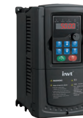
Goodrive35 闭环矢量控制变频器